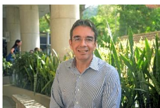
Fez graduação e mestrado em Economia na UFMG e doutorado em Economia na PUC-Rio.

José Carlos Carvalho: Engenheiro florestal e servidor público de carreira aposentada. Foi ministro do Meio Ambiente no governo Fernando Henrique Cardoso. Em 2002 representou o Brasil na Rio + 10 em Johannesburgo, na África do Sul. Foi conselheiro na Conama, representando o estado de MG de 2003 a 2009. Em 2007 foi eleito membro do Conselho da Administração da Companhia de Saneamento de Minas Gerais (COPASA-MG) e reeleveu-se em 2009. Atuou como o secretário de Meio Ambiente e Desenvolvimento Sustentável de Minas Gerais de 2007 a 2010. Ao longo da carreira representou o Brasil em diversos eventos internacionais. Atualmente